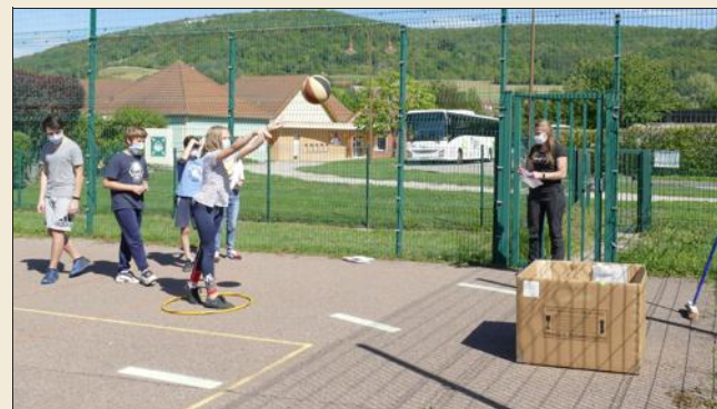
Parmi les défis : lancer la balle dans un carton.