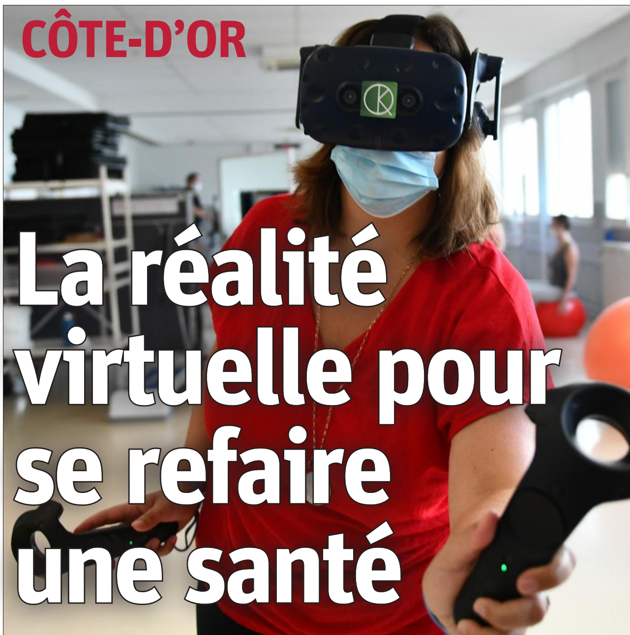
Nous avons testé pour vous une séance d'ergothérapie-réalité virtuelle à la clinique des Rosiers, à Dijon. Patients et soignants expliquent les bénéfices à tirer de ces nouvelles méthodes. PAGES 2 ET 3